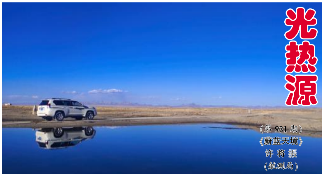
(第931期) 《蔚蓝天境》

冬天 地勘人来到了杳无人烟的沙漠 呼啸的寒风为世界披上了银装 寂静的世界里藏着一颗心 准备迎接更加辉煌的明天