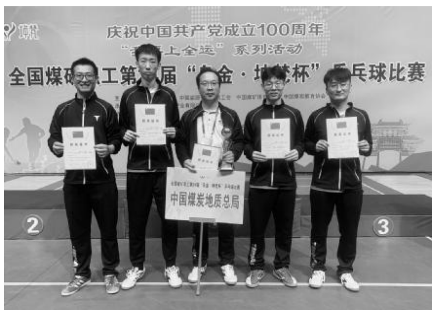
5月9日,庆祝中国共产党成立100周年“我要上全运”系列活动之全国煤田地质局第二届“乌金·地梵杯”乒乓球比赛圆满举行,中国煤炭地质总局乒乓球队首次参赛,经过顽强拼搏,荣获青年组男子团体第四名。本次比赛由中国煤炭工业协会、中国能源化学地质工会、中国煤矿体育协会、中国煤炭教育协会主办,来自全国20家煤炭企业的200余名选手参加了比赛。

◆近日,山东省煤田地质规划勘察研究院结合党史学习教育,举办了青年劳动成果展,展示该院青年干部职工在工作中取得的科技成果和荣誉奖项,同时将这些成果通过微信公众号等媒介进行了宣传。成果展旨在为青年干部职工提供一个展示自我的平台,进一步激发大家科技创新的热情。杨光烁