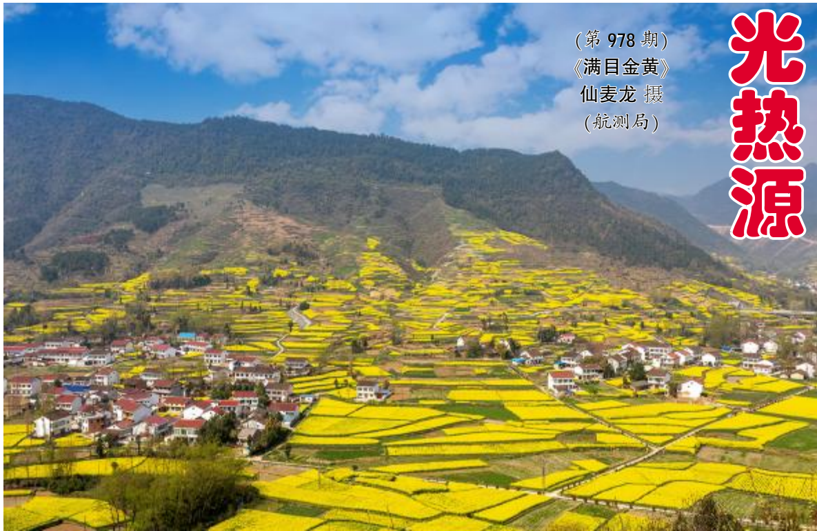
(第978期) 《满目金黄》

抗美援朝猎虎虬，白穷创业画新图。 三中全会拨迷雾，开放改革展大道。 反腐经贸风景好，扶贫战疫政体优。 创新驱动千里日，中华复兴万载久。