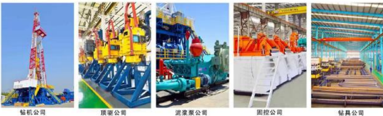
钻机公司 顶驱公司 泥浆泵公司 固控公司 钻具公司

河北永明地质工程机械有限公司占地26万平方米，拥有固定资产近5亿元，各类加工设备650余台套，集团拥有钻机公司、顶驱公司、泥浆泵公司、固控公司、钻具公司五大公司，获得美国石油学会API-5项认证，公司现是中国地质大学智能化钻井装备的战略合作单位。主要生产9000米以内的成套钻井装备及电动直驱顶驱系列产品。