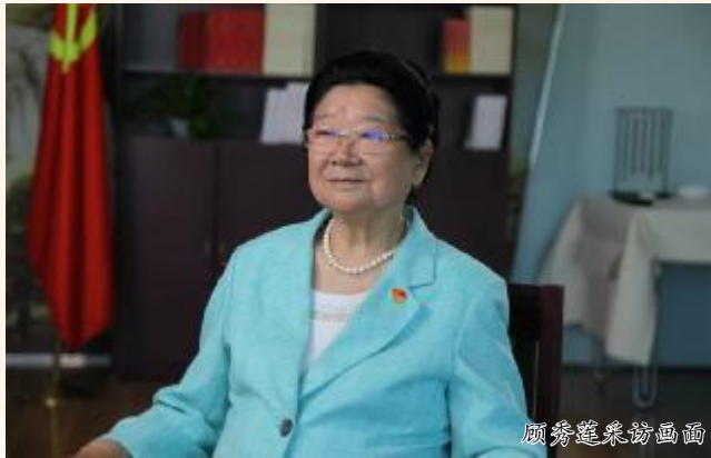
顾秀莲委员采访画面

《矿海匠心》的摄制，受到了第十届全国人大常委会副委员长、原化工部部长顾秀莲的充分认可。她在访谈中谈道，“中化地质矿山总局是伴随着新中国化学工业成长起来的，多年来在国家矿山企业建设、资源勘查、生态建设等方面成绩卓越，为保障国家战略性矿产资源安全和粮食安全作出了重要贡献。现在你们做这项工作，对过去的历史进行回忆，通过文化形式把历史总结好了，这样可以看出我们在历史发展的过程中所走的路，看出来有哪些成绩，有哪些经验，在这个基础上，在新的时代，继续奋斗，更加有为。”