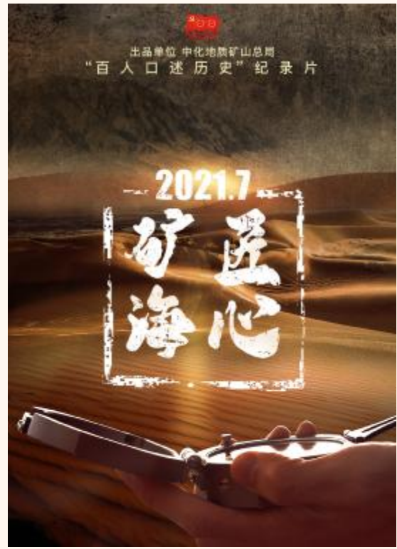
质人工作状态和精神意蕴的写实题材作品。

7月28日，由中化地质矿山总局（中化明达控股集团有限公司）出品的大型化工地质题材百人口述历史纪录片《矿海匠心》正式首映。