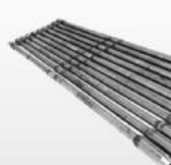
整体加重钻杆 Integral heavy weight drill pipes