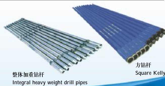
整体加重钻杆 Integral heavy weight drill pipes