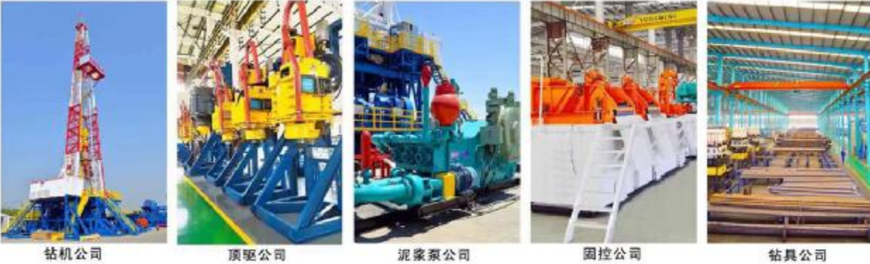
钻机公司 顶驱公司 泥浆泵公司 固控公司 钻具公司

河北永明地质工程机械有限公司占地26万平方米，拥有固定资产近5亿元，各类加工设备650余台套，集团拥有钻机公司、顶驱公司、泥浆泵公司、固控公司、钻具公司五大公司。获得美国石油学会API-5项认证，公司现是中国地质大学智能化钻井装备的战略合作单位。主要生产9000米以内的成套钻井装备及电动直驱顶驱系列产品。