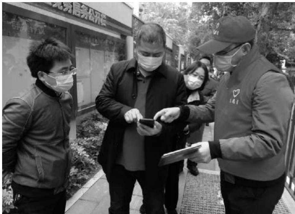
近日,福建省煤田地质局院党总支联系驻地社区开展了“佳节尚文明·志愿关爱行”疫情防控志愿服务活动。志愿者们下沉驻地社区,组织居民有序排队,引导其扫码进行核酸检测,并向群众普及最新的防疫知识及防控措施。