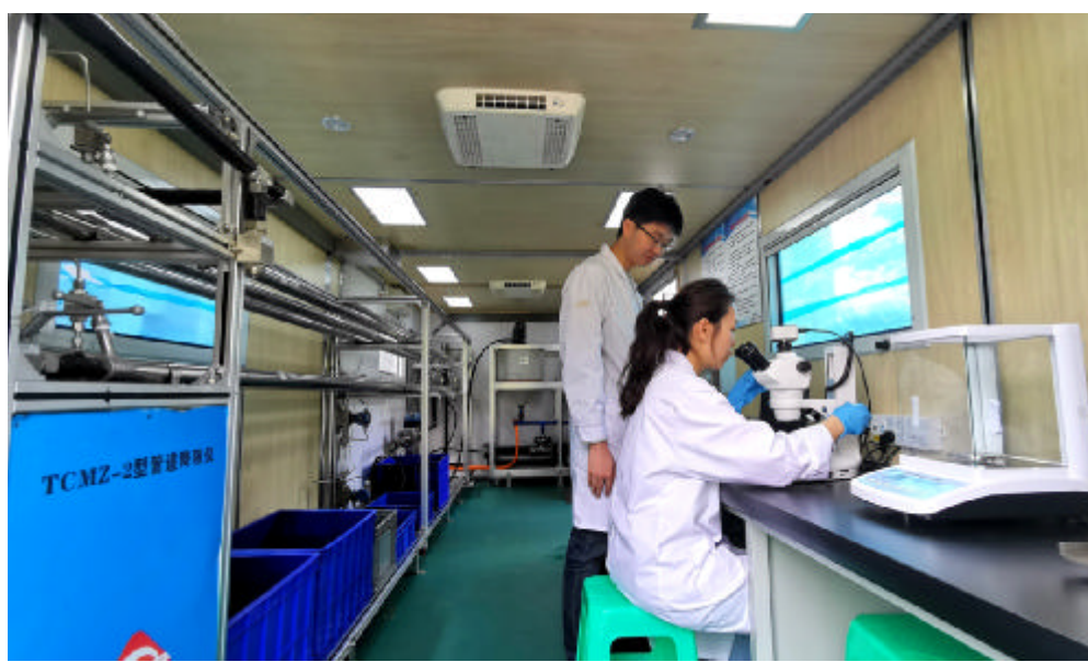
近日，重庆地质矿产研究院建成重庆市首个页岩气移动检测实验室。该实验室配置了性能先进的压力强度机、六速旋转黏度计、管道降阻仪、顶击式振筛机等设备，可开展滑溜水压裂液、压裂支撑剂、压裂用水等10余项主要控制性参数的检验检测，通过对页岩气压裂快速、及时、高效的现场质量检验，更好满足页岩气开发企业的品控需求。