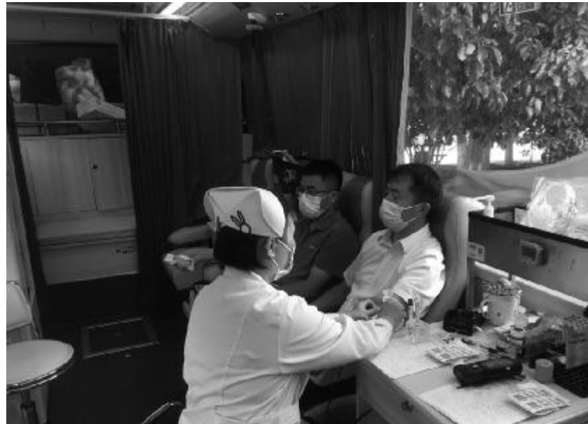
7月7日,安徽省煤田地质局组织机关、勘查研究院干部职工参加无偿献血活动。在工作人员的引导下,17名干部职工依次登记信息、测量血压、抽血化验、献血。大家表示,要通过实际行动弘扬志愿服务精神,奉献自己的一份爱心。

物资采购、财政资金使用等关键环节和重点项目开展监督检查,查摆问题80余项,提出工作建议60余项;2021年,公司印发了《集中整治形式主义官僚主义工作方案》。今年,该活动持续开展,并与山西省地质勘查局“转观念、强作风、提效能”专项活动相互融合、一体推进;3月,公司印发《提醒谈话、诫勉谈话办法》,就工作作风等问题开展提醒谈话1次;5月,公司纪委严肃用人纪律,规范开展任前考察、任前公示和任前谈话,对不符合任职条件的干部中止推荐使用;以纠正“节日病”为契机,初步形成了节前通报曝光、节中监督检查、节后督促整改的工作机制。公司把制度建设贯穿作风建设全过程,查漏洞,补短板,引导党员干部知责于心、担责于身、履责于行,不断提升作风建设工作实效。