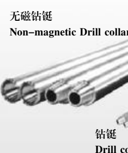
无磁钻铤 Non-magnetic Drill collar