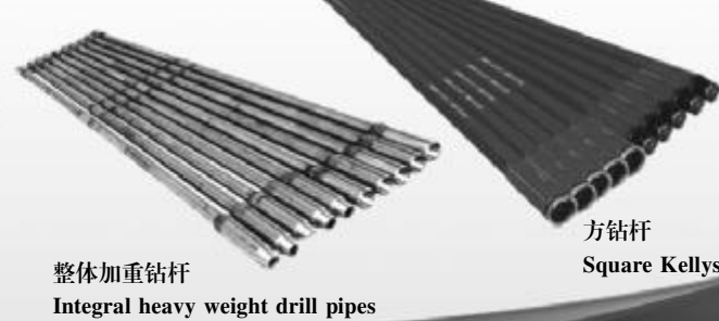
整体加重钻杆 Integral heavy weight drill pipes 方钻杆 Square Kellys