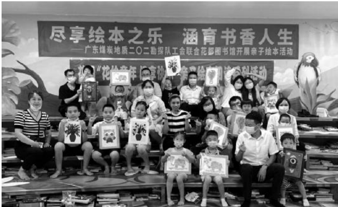
8月25日,广东煤炭地质局二〇二队工会联合花都图书馆开展亲子绘本活动,共12组亲子家庭参加。花都图书馆文化志愿者陈泳臻带来《七彩下雨天》绘本分享,职工和孩子们参观了《传承文物经典·保护生态文明》暨第三届广州市花都青少年书画大赛书画展;全队职工通过工会向花都图书馆捐赠图书110册。职工们在活动中体验了阅读的快乐,增进了与孩子间的感情。

工作12年来,孙红波从一个刚毕业的学生,成长为公司的技术骨干,并于今年获得中国煤炭地质总局“优秀共产党员”称号。他说,前进的道路没有终点,从庄严地举起右拳面向党旗宣誓的那一刻,肩上便多了一份责任。今后,他将继续用卓有成效的工作表现,兑现在党旗面前的庄严承诺!