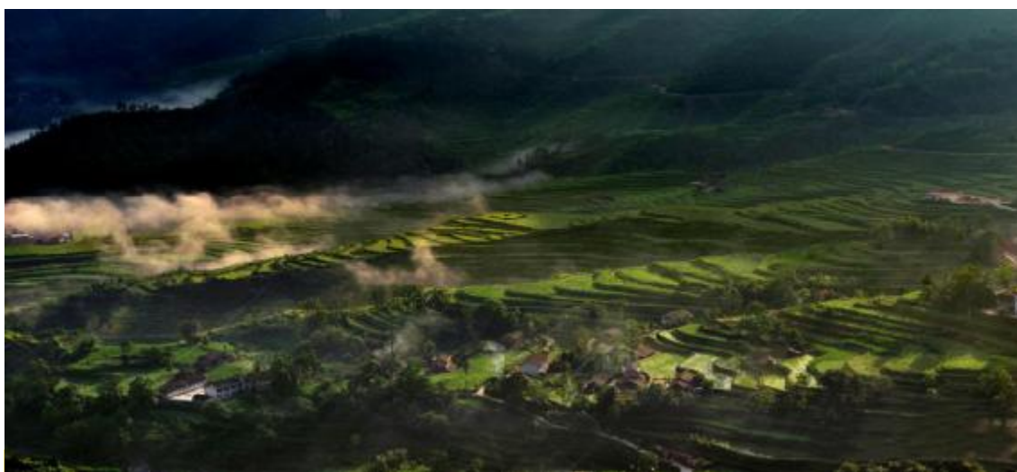
（第1089期） 《秀山千丘梯田》