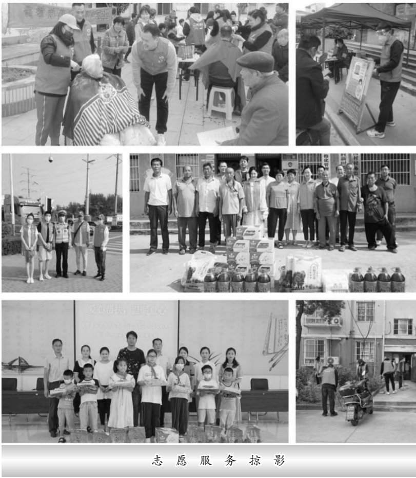
志愿服务活动掠影

有一种无微不至的关心温暖着你，有一种不求回报的服务帮助你。这关心、这服务来自于一群可爱的人——安徽省煤田地质局一队志愿服务队的志愿者们。