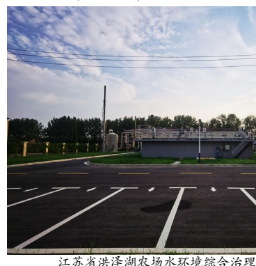
江苏省洪泽湖农场水环境综合治理EPC项目

草沙一体化保护和系统治理,因地制宜、分区分类施策,承建了多个“山水工程”,实现了生态效益、经济效益和社会效益的综合提升。