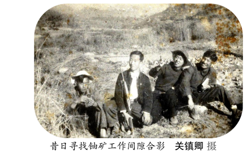
昔日寻找铀矿工作间隙合影