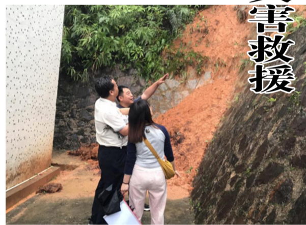
广东局一五二队开展地质灾害巡查工作