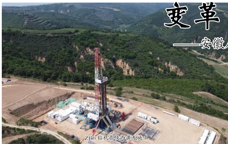
ZJ50钻机在陕西黄龙施工

成立于1952年的安徽省煤田地质局一队，是我国首批组建成立的煤田地质勘探队伍之一，曾受到中共中央办公厅的来电勉励。72年来，一队人风餐露宿、南征北战，足迹踏遍安徽、新疆、云南、山西、贵州、陕西、内蒙古等地，累计完成煤田勘探工程量300多万方，先后提交各类地质报告千余份，探明煤炭资源储量近200亿吨，经该队勘探已建矿井24对，为两淮煤炭能源基地建设作出了突出贡献，先后获得全国煤炭工业“特别能战斗队伍”、“全国工人先锋号”、“全国煤炭工业地质勘查先进单位”等多项荣誉称号。